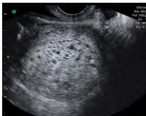
Figura 1. Ecografía transvaginal que muestra la cavidad uterina ocupada por imagen en panel de avejas.